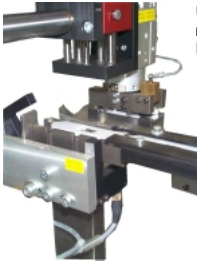
Unterteil-Einsetzstation mit Lageerkennung und Drehmodul