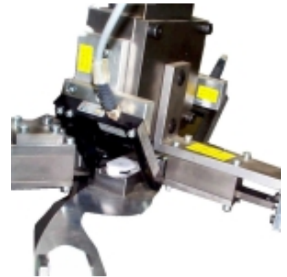
Verrastungs- und Bau- teilkontrolle.