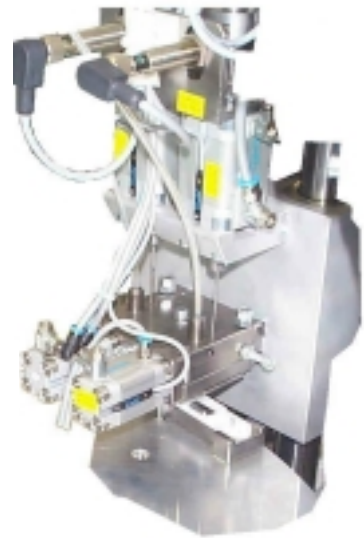
Doppelmontagestation für Rollenachse. Schnellvereinzelnung mit Montagekontrolle und Stiftlängenabfrage