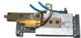
Standard Heißprägeeinrich- tung

Vorrichtungen sind mit einer Einsteck- aufnahme sowie integrierter Spannein- richtung versehen. Die Adaption des Prüflings (Stecker) wird mittels Prüf- und Schaltstiften erzeugt. Bei I.O.-Teilen werden die Ausströmer automatisch mit einem Heißpräge- Kennzeichen versehen.