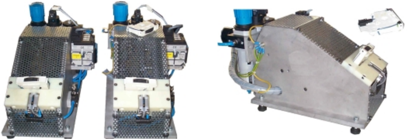
Vorrichtung der seitlichen Ausströmer in rechter und linker Ausführung.

Große Anzahl von unterschiedlichen Prüf- und Montagevorrichtungen insbesondere für die Automobil-Zulieferindustrie. Beispiele: Prüfung der Stromstärke von LED-Beleuchtungen an Lasersymbolen, optische Prüfung von Zahnrad-Eingriffsverhältnissen, optische und mechanische Prüfung von montierten Bauelementen (z.B. an Lüfterdüsen, Cupholder, Mittelkonsole, A-Säule)