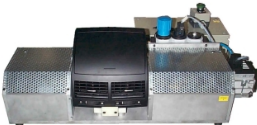
Vorrichtung des Ausströmers Mitte mit Ablagefach.